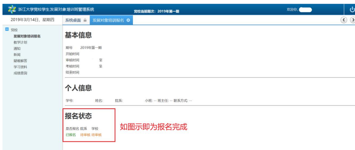
图 4 报名成功