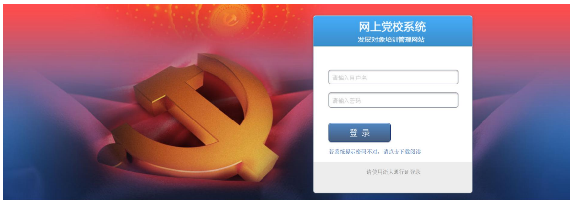
图 1 登陆界面

输入网址: www.youth.zju.edu.cn/dangxiao , 在登录界面用 浙江大学统一身份认证账号和密码登录 (若点击图标无响应, 请更换浏览器。该系统要求 IE5.0 以上版本的浏览器)。