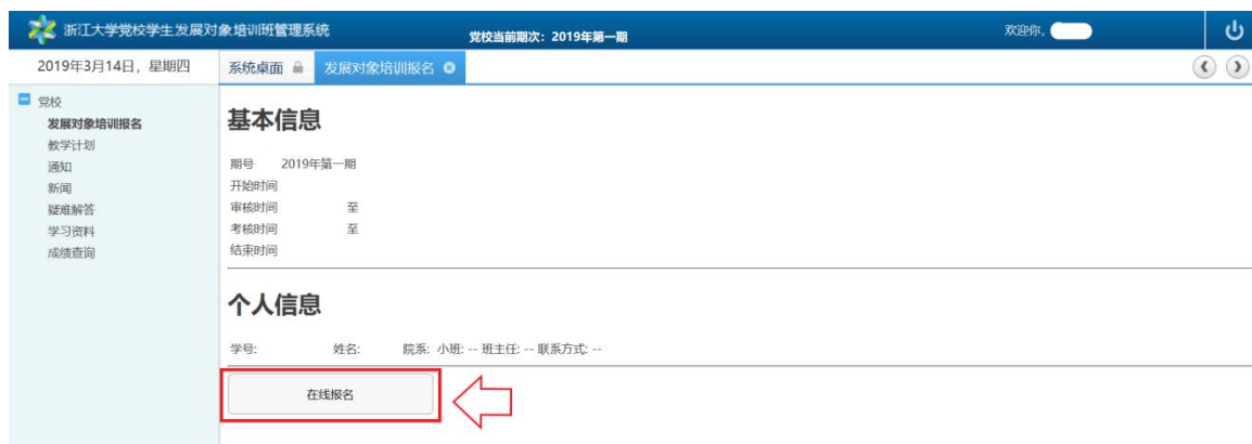
图 3 在线报名